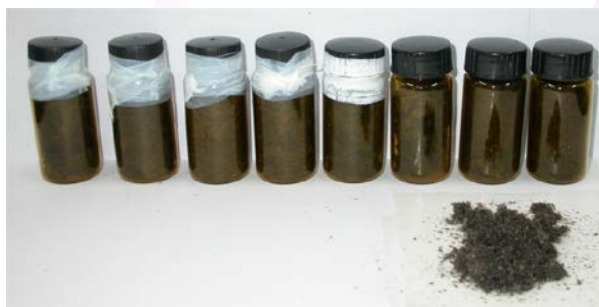
图 2、可溶性石墨烯的批量制备

本项目首先发展了一种可大量制备的可溶性功能化石墨烯（SPFGraphene）的方法，实现了石墨烯的百克级制备（图 2）。通过透射电子显微镜及原子力显微镜确定了石墨烯的二维平面结构。