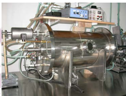
图 1、自制的 SWNTs 合成反应器

本项目发明了一类新的催化剂和大量制备 SWNTs 的方法，实现了高质量单壁碳纳米管的宏量制备（图 1），纯度达 70%以上，并达到了产业化规模（达 200 公斤/年以上）。