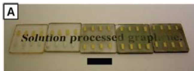
图 3、基于石墨烯的透明电极材料

获得了可溶性石墨烯材料及柔性透明导电薄膜（图 3）；制备了基于石墨烯的高稳定性有机光伏电池及复合材料。