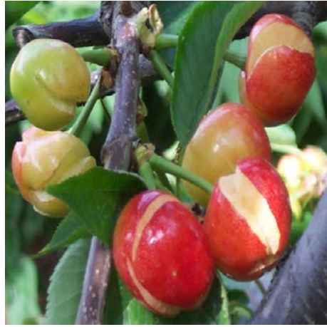
防治裂果 左图：实验组，右图：对照组